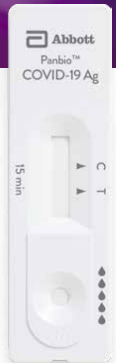
Panbio™ COVID-19 Ag Rapid Test Device